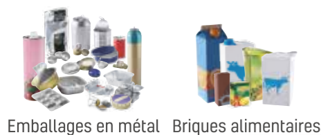
Emballages en métal Briques alimentaires